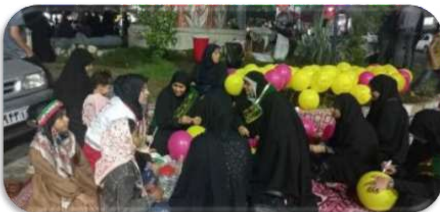
آموزش ایمنی در شرایط جنگی و حملات هوایی میدان شهدا - شهرستان میناب