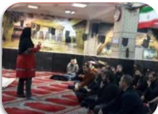
آموزش ایمنی و امداد رسانی در شرایط جنگی مسجد سید الشهداء میدان انقلاب تهران

در این مدت دوره‌های آموزشی حضوری مرتبط با ایمنی و آمادگی در شرایط جنگی بصورت آموزش ایستگاهی در میادین پرتدد، مساجد و پایگاه‌ها و تجمعات مردمی و آموزش حضوری ایمنی در شرایط جنگی برای عموم مردم در سراسر کشور برگزار شد.