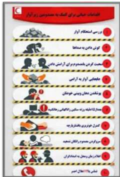
سیستان و بلوچستان