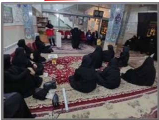
چهار محال و بختیاری