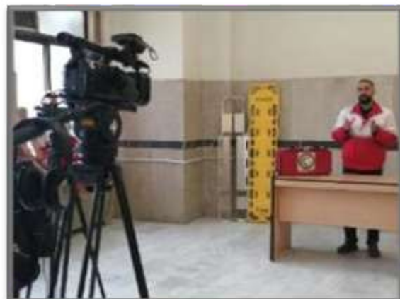
همدان - رسانه ملی