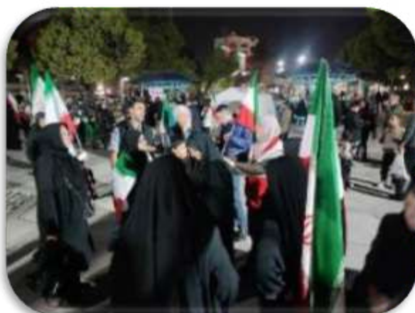
آموزش ایمنی و امداد رسانی در شرایط جنگی میدان نبوت منطقه ۸ تهران