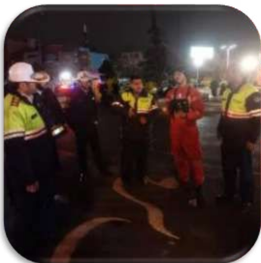
آموزش مباحث ایمنی در شرایط جنگی و کمک‌های اولیه برای پرسنل راهور - میدان ونک تهران