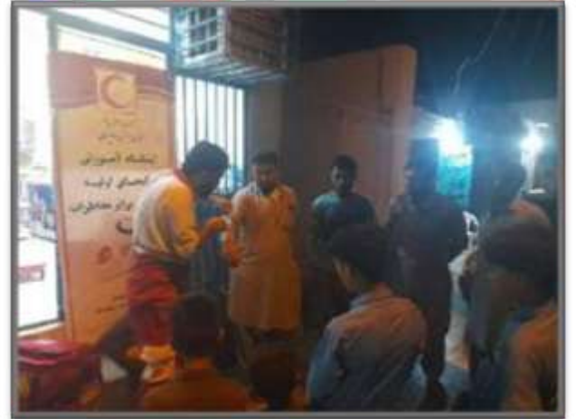
سیستان و بلوچستان